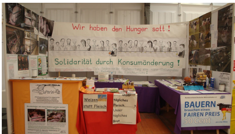
Unser Informationsstand auf dem MdM in Stuttgart